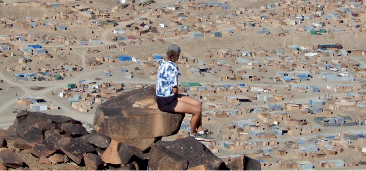
▲ Blick auf das Aussenkehr Dorf.