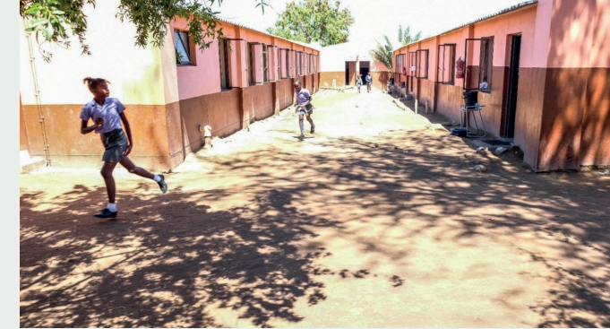
▲ Aussenkehr Grundschule.

Die Zeit auf dem afrikanischen Kontinent war für uns und alle, die das Projekt unterstützten so lehrreich, dass es uns motivierte die Grundidee des Volunteer Projektes im Oktober 2020 nach Namibia zu tragen. Pro Jahr arbeiten zwei bis drei Volontärteams in Aussenkehr bestehend aus sechs bis acht Student*innen, die für 4-6 Monate (Kurzzeit) oder 12 Monate (Langzeit) in den Süden Namibias kommen. Dort werden sie von vier Junior-Volontär*innen, Schüler*innen der Klasse 7, der höchsten Klassenstufe der Aussenkehr Grundschule, unterstützt. Mit Ende des Jahres 2022 haben sechs Teams Erfahrungen in Aussenkehr gesammelt.