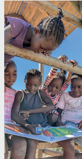
Life Skill Workshop: Lesen ▲ ▼ auf dem Schulgelände.

Viele ihrer Schützlinge sind die Kinder von Saisonarbeiter*innen, die jedes Jahr für die verschiedensten Arbeiten im Weinanbau, insbesondere aber zur Ernte, aus allen Teilen Namibias anreisen und nach Saisonende in ihre nördlichen Heimatregionen zurückkehren – die meisten ohne ihre Kinder. Sie bleiben, besuchen weiter die Schule und wenn sie keinen Unterschlupf bei Bekannten finden, betreuen die älteren Geschwister die Jüngeren. Die daraus für die Schule entstehenden Aufgaben und Herausforderungen sind enorm.